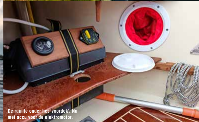
De ruimte onder het 'voordek'. Nu met accu voor de elektromotor.