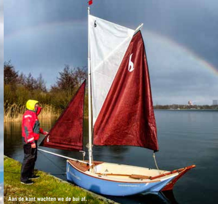
Aan de kant wachten we de bui af.