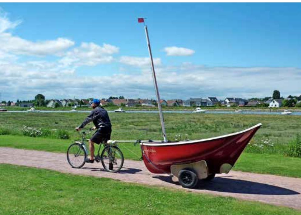
De bewuste foto van de flyer; een van de redenen om met de Gazelle te gaan varen. Denk aan je doorrijhoogte!