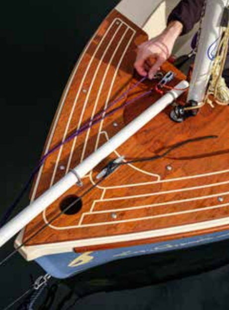
Met boegspriet staat de mast zo'n 40 cm verder naar achteren.