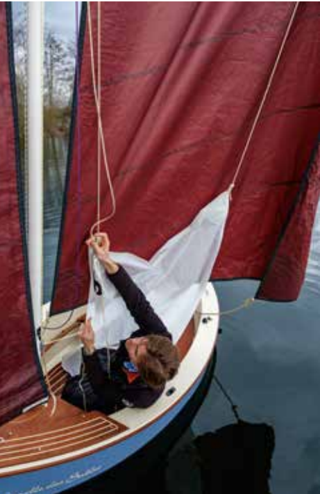
Topzeil en kluiver hijs je vanuit de kuip.