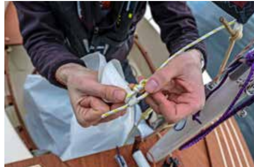
Geen zware sluitingen in het val, maar een Bretonse knoop.