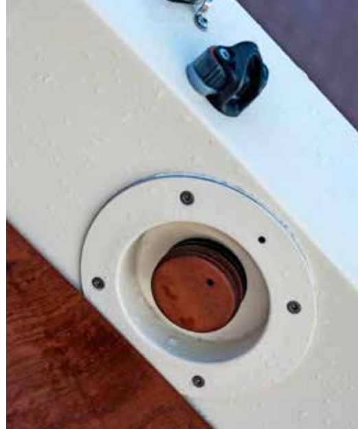
De snelheidsregelaar is ook in hout uitgevoerd.