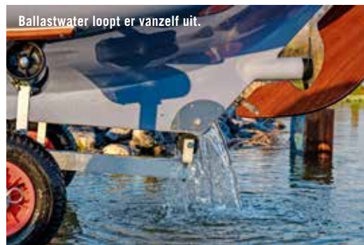
Ballastwater loopt er vanzelf uit.

“zodat je hem ook met een val kunt uitschuiven.” Nu moet de volledige mast uit de boot en daarvoor moet je het tuig weer strijken. Zo gedaan, maar toch. Het topzeil en de kluiver zijn van lichtgewicht wit zeildoek en steken mooi af bij de bruine Dacronzeiltjes. In plaats van de kluiver kan er ook een gennaker worden gehesen.