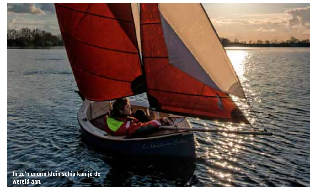
In zo'n enorm klein schip kun je de wereld aan.

Leverancier Boten en bijzaken +31 (0)614656163, info@boten-en-bijzaken.nl, www.boten-en-bijzaken.nl